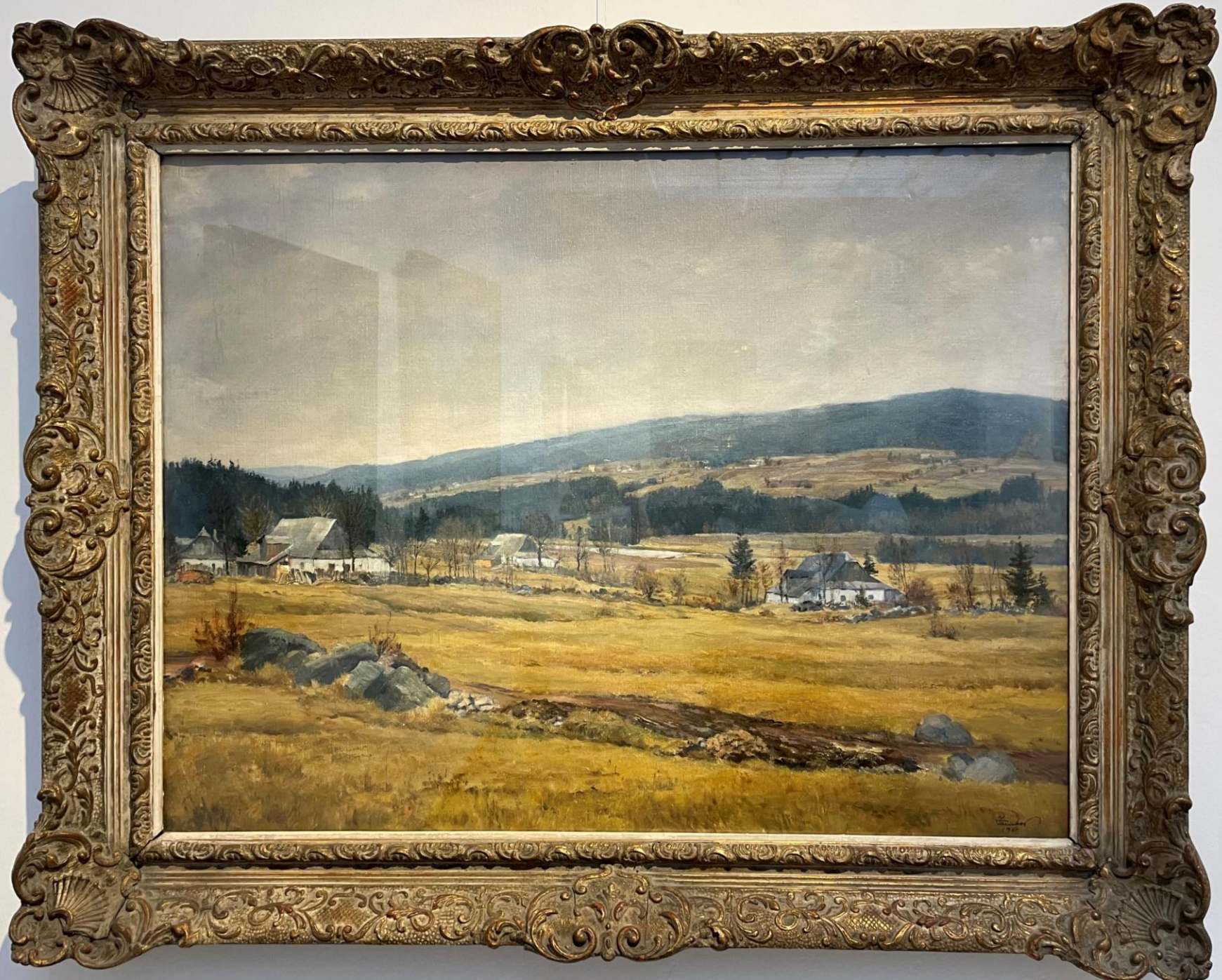
Josef Jamber Frühjahr Öl auf Leinwand | 1918 Early Spring oil on canvas | 1918