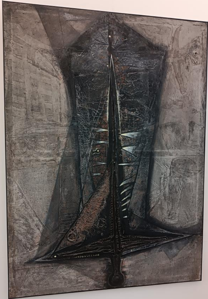
Francis Bacon Two Figures in a Room 1944