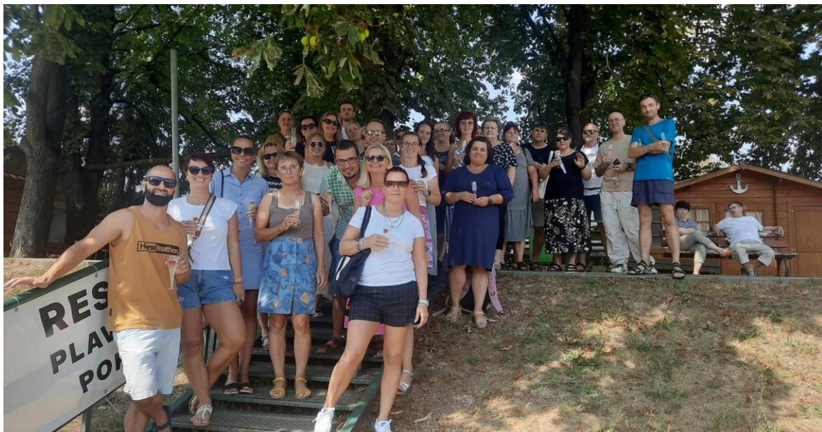
Zaměstnanci GOAH – pohodové vplutí do školního roku na lodi Konstancie