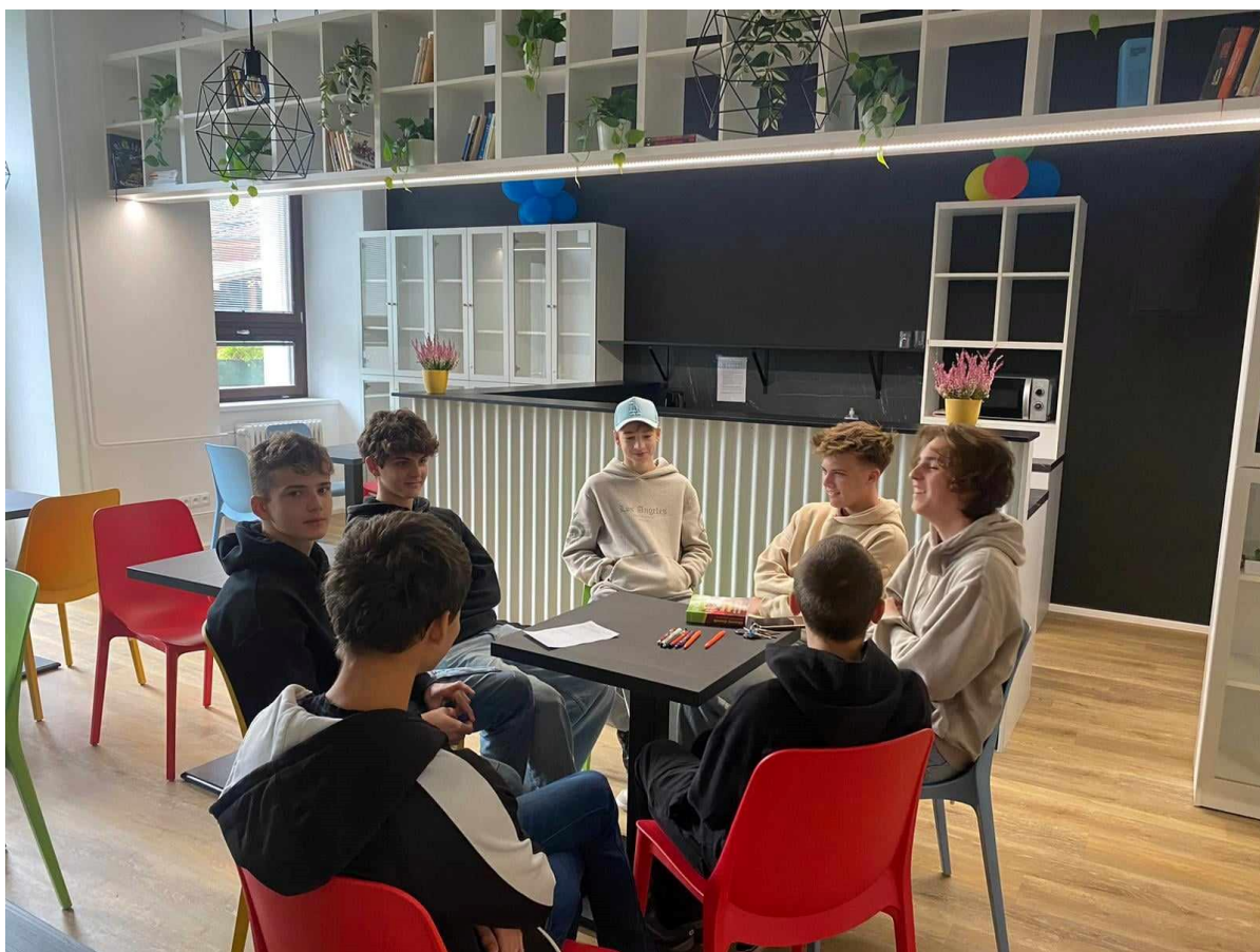
Zrekonstruovaný školní klub na gymnáziu