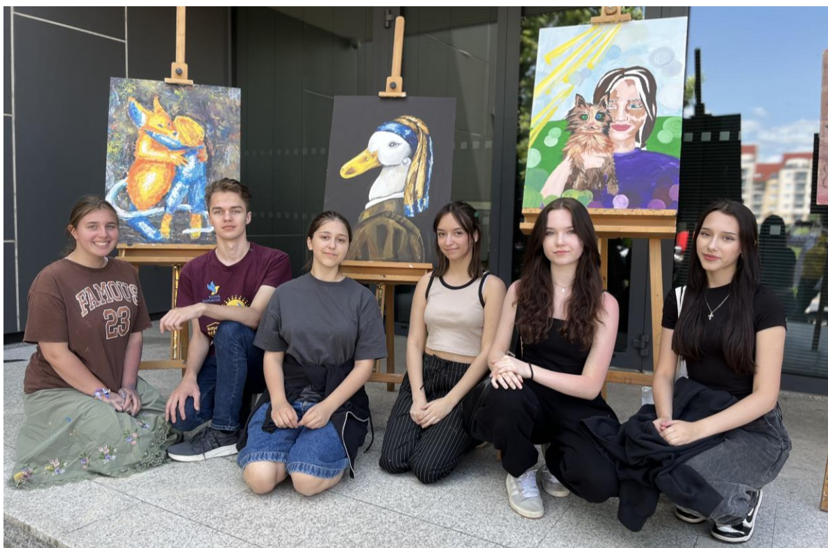
Kroky k umění