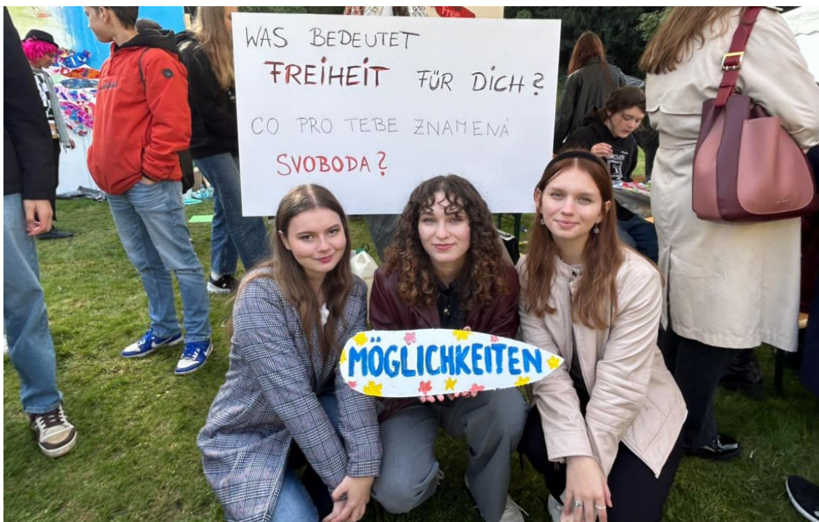
Návštěva německého velvyslanectví v Praze