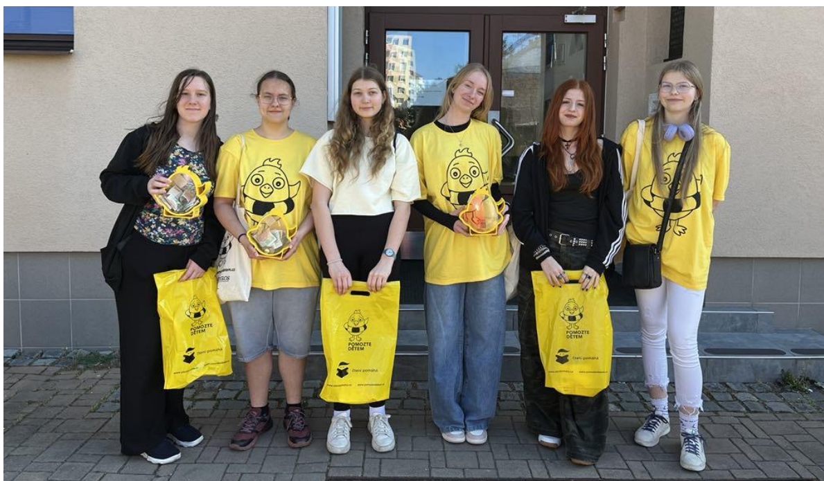
Charitativní sbírka ČT Pomozte dětem