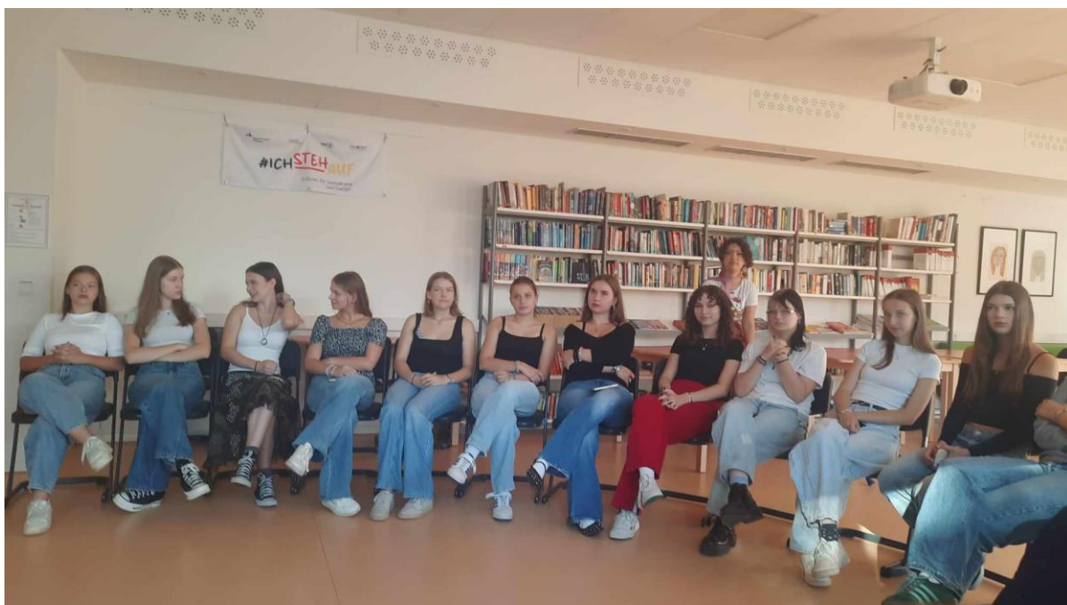
Projektové setkání Erasmus+ na Marie-Kahle Gesamtschule v Bonnu