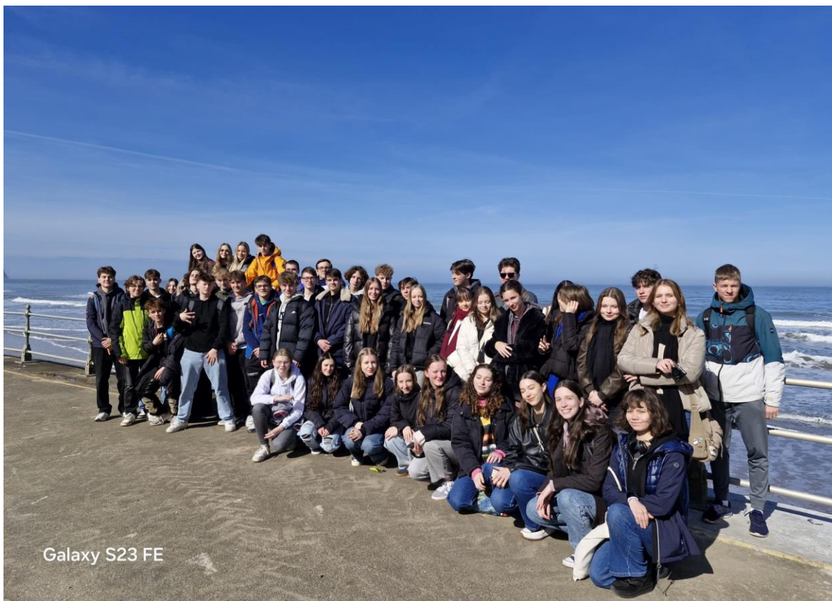
Jazykový zájezd do Yorku