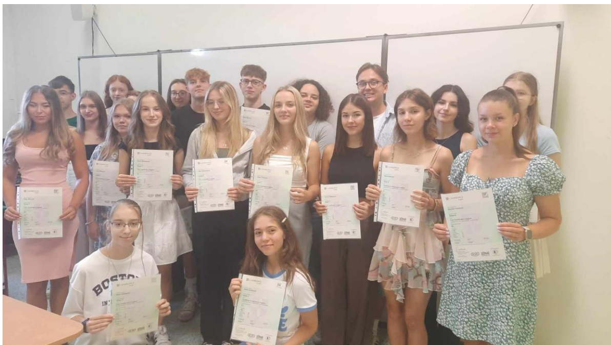
Slavnostní předávání certifikátů FCE a CAE