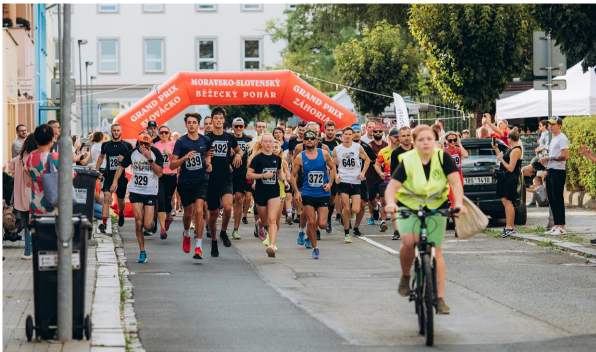
Charitativní běh GOAH u příležitosti oslav 130. výročí gymnázia