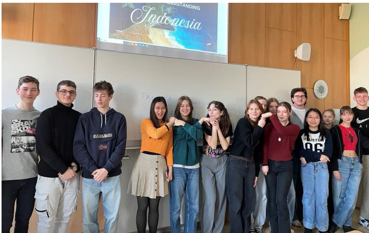
Youth 4 Impact