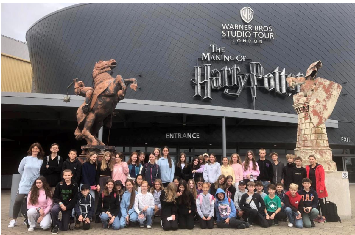
Poznávací zájezd do Anglie pro nižší gymnázium