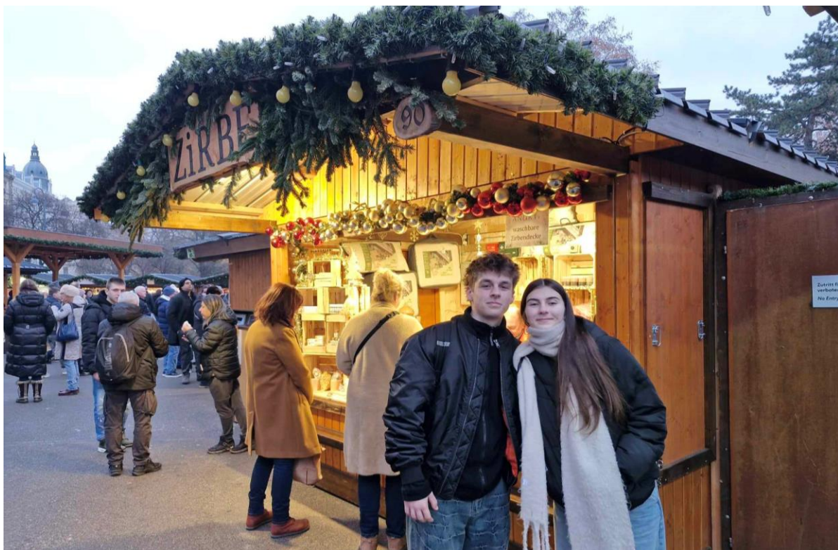
Návštěva adventní Vídně