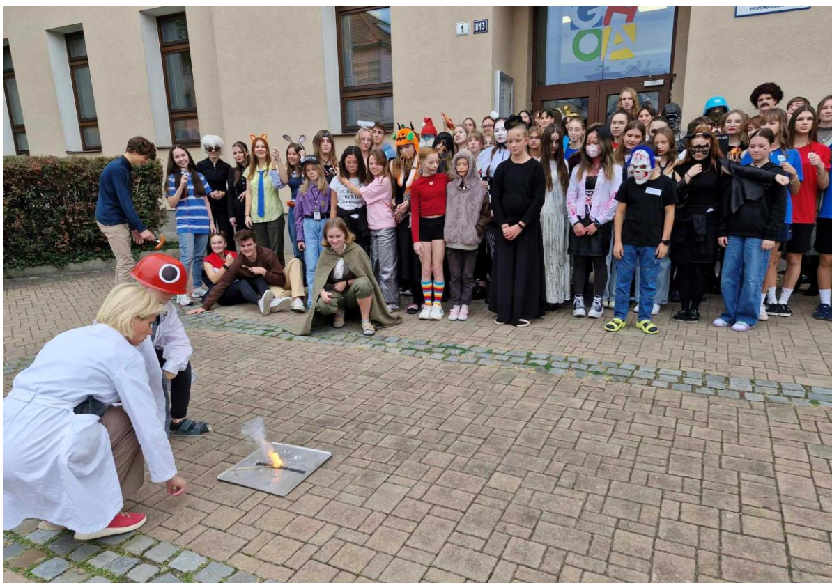
Halloween na gymnáziu