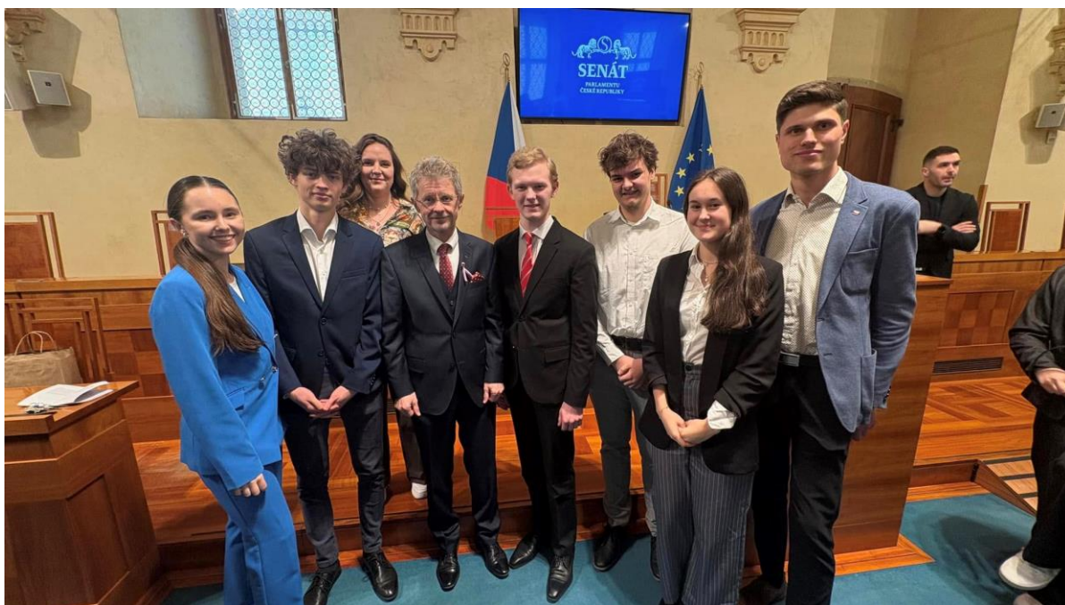
Návštěva Senátu ČR