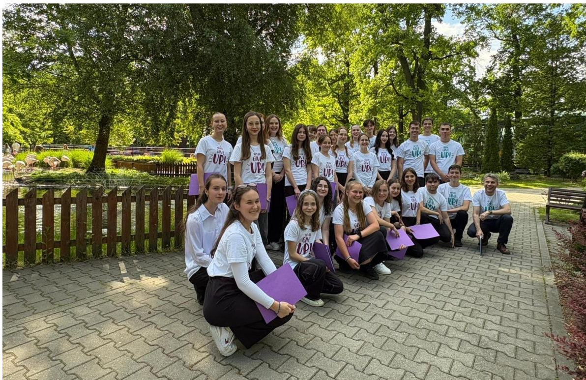
Pěvecký sbor Barbastella