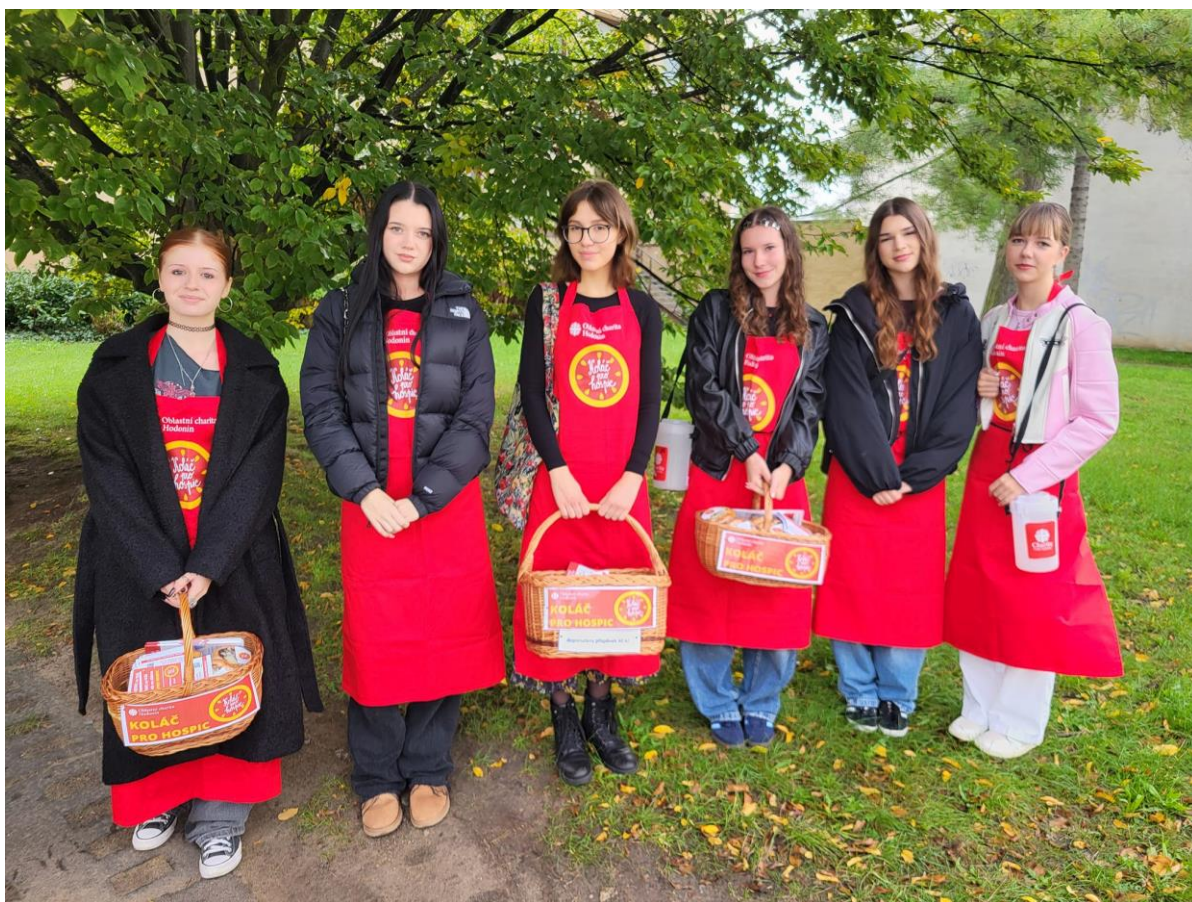
Charitativní akce Koláč pro hospic